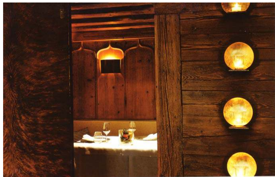
Oben links: Gemütlicher Zeitgeist: das Restaurant KäferSchänke im neuen Look | Oben rechts: Eine von 12 individuell gestalteten Stuben