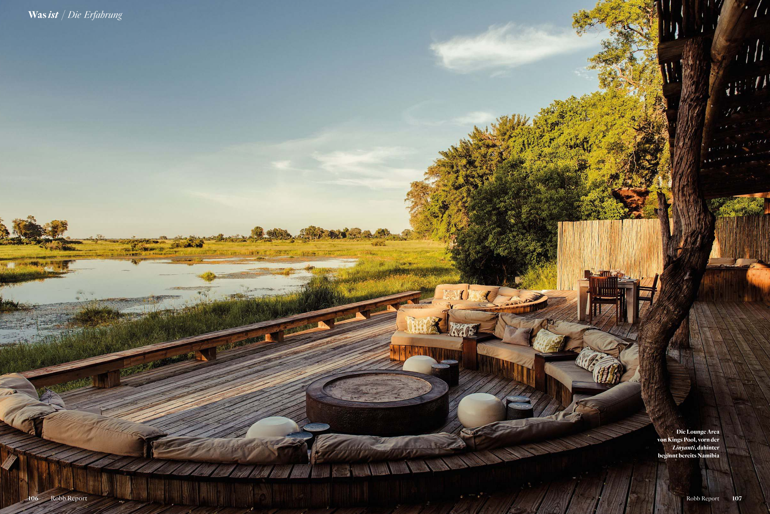
Die Lounge Area von Kings Pool, vorn der Linyanti , dahinter beginnt bereits Namibia