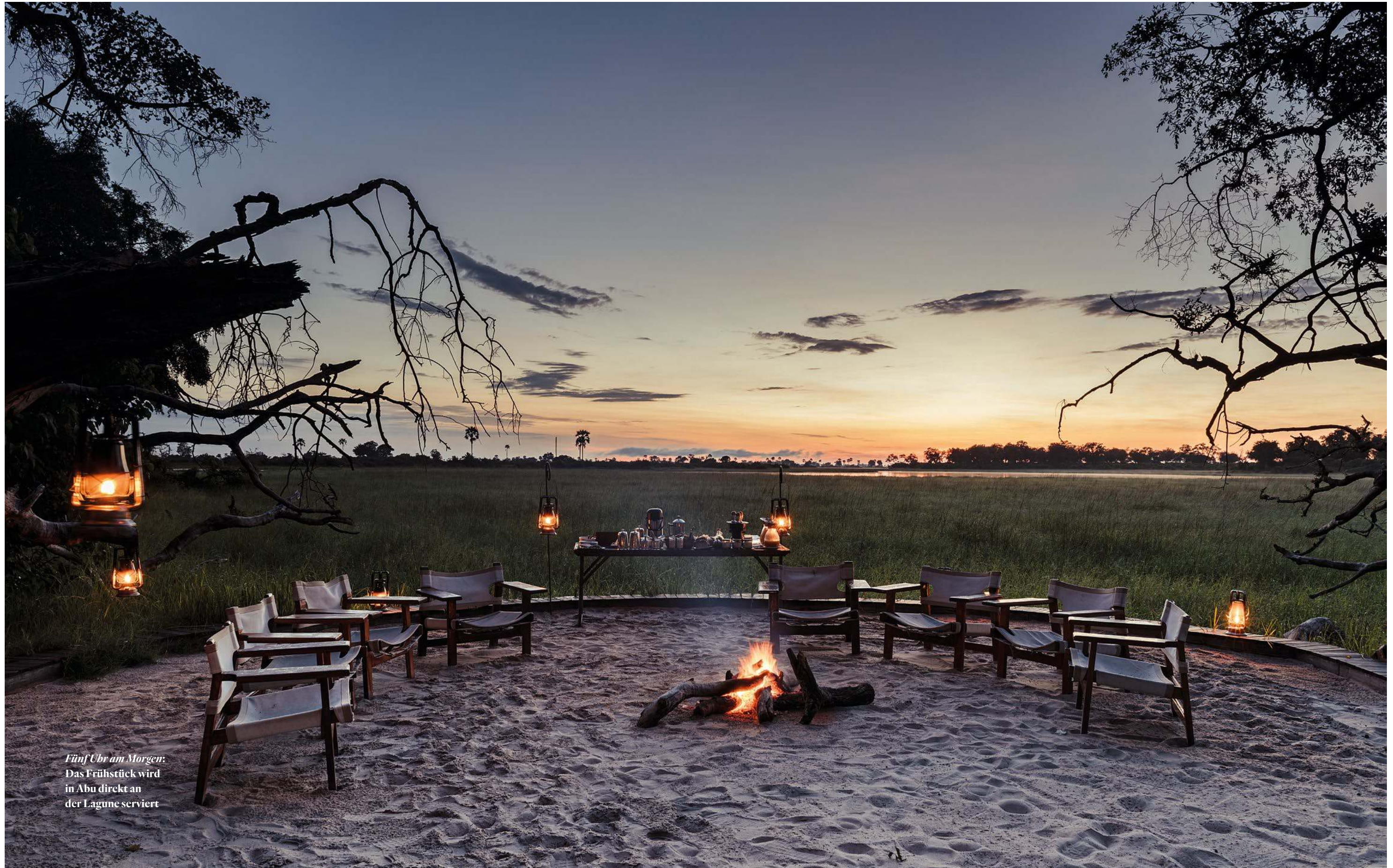
Fünf Uhr am Morgen: Das Frühstück wird in Abu direkt an der Lagune serviert